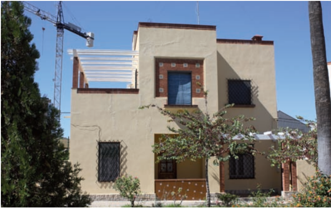
Fig. 4– Vivienda para ingenieros con cubierta plana.

pero eficazmente resueltos en un conjunto humanizado y agradable muy superior en los ocho chalets, al resto” 13 . Además de este pequeño conjunto, el Instituto Nacional de la Vivienda llevó a cabo varias promociones para los trabajadores de la factoría 14 .