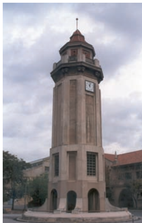
Fig. 2- Torre de aguas.

Atravesando la portería (24), la torre de aguas (26) destaca al centro de la avenida principal. En noviembre de 1948 se encontraba terminada su cimentación 9 . Se trata de una construcción de planta octogonal levantada con una estructura de hormigón armado. Las esquinas se resaltan con fajas, compartimentando así cada una de las caras con paneles rehundidos. Se remata con una cornisa sostenida por ménsulas, sobre la cual se levanta un cuerpo cubierto con teja de escamas. Se recurre a un lenguaje arquitect-