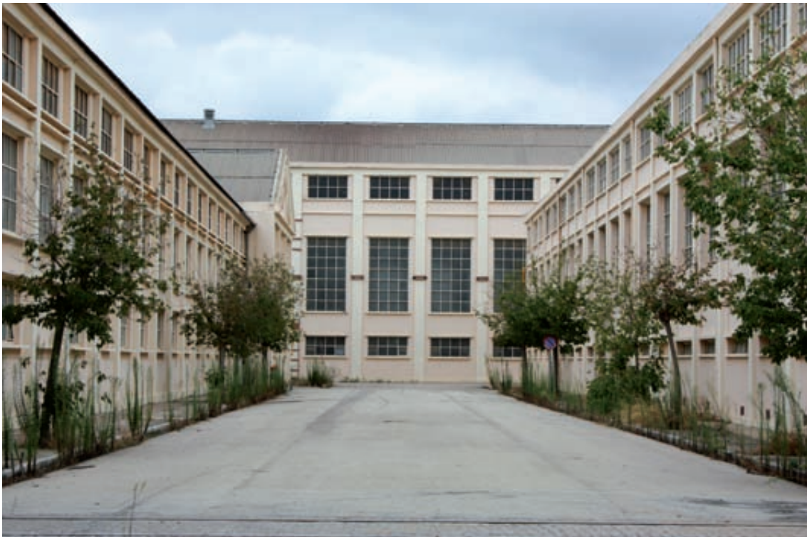
Fig. 10– Calle interior que separa los talleres de monturas y de tratamientos térmicos.

que se hace de los elementos edilicios, aunque su valor intrínseco recomienda que no se modifiquen ni su volumetría ni sus cerramientos exteriores. En un futuro se podrían reconverter al uso dotacional algunos de sus elementos más destacados, manteniendo la configuración urbana entorno al bulevar y remodelando sus interiores para adaptarlos a los nuevos usos, pudiendo configurar una zona de equipamientos de gran interés”.