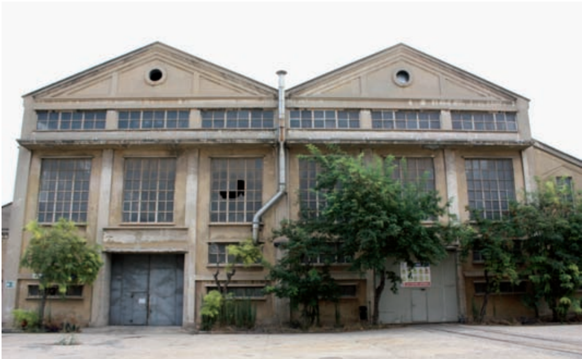
Fig. 11- Testero de las naves del taller de fundición.