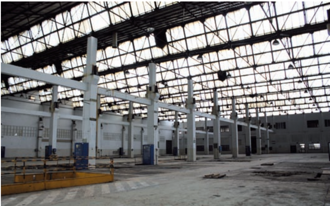
Fig. 12- Interior de las naves del taller de motores.