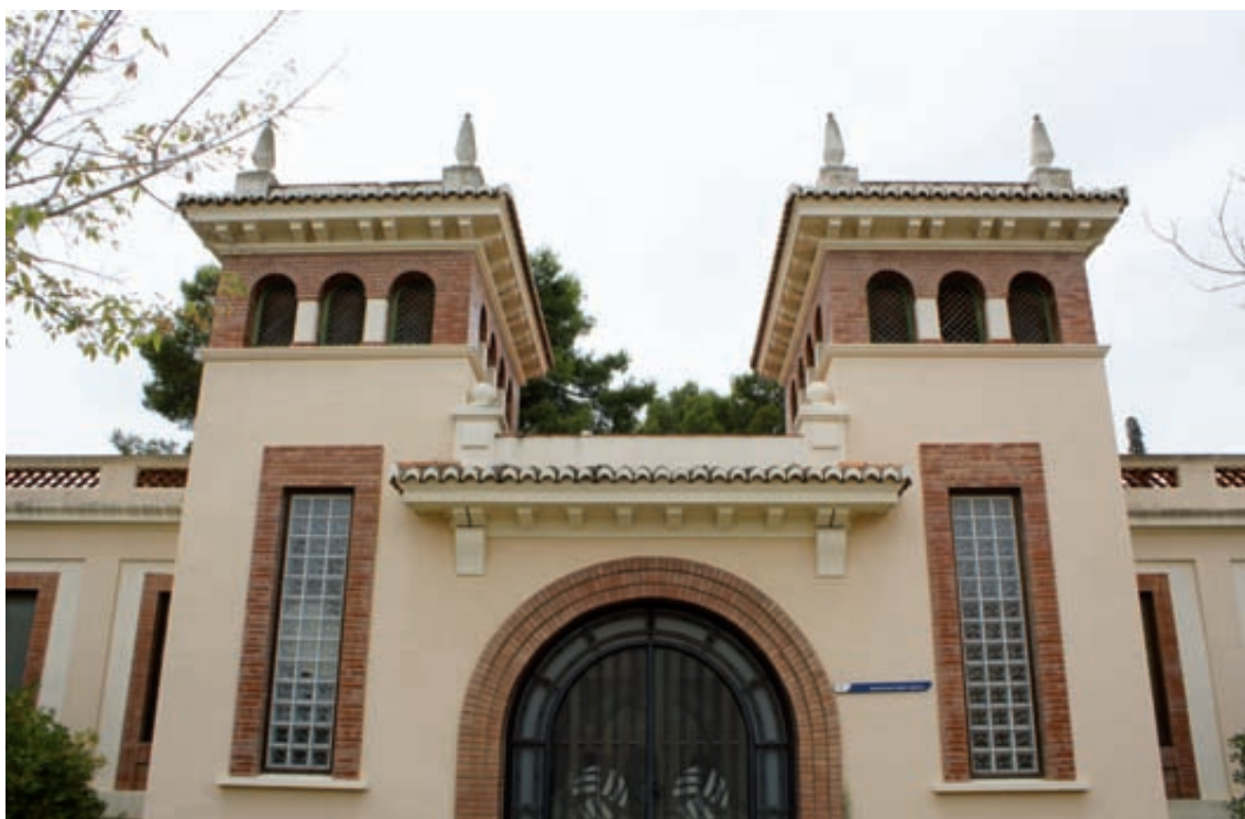
Fig. 3- Puerta de acceso al edificio de laboratorio.

extremo por sendos cuerpos sobresalientes cubiertos con cuatro faldones de teja árabe en su mitad posterior. La composición de las fachadas es bastante sencilla, respondiendo a un modelo unitario que recorre longitudinalmente los lienzos murales basada en un zócalo, las oberturas y sus embocaduras enmarcadas con una banda de ladrillo visto, sirviendo como remate la cornisa, sobre la cual se dispone el antepecho de la cubierta o el alero de la cubierta según el caso. Este conjunto destaca por su horizontalidad, que se ve contrarrestada por la presencia de dos torres que enmarcan la puerta de acceso, que evocan un cierto historicismo concebido bajo una estética Déco al estilizar sus elementos de-