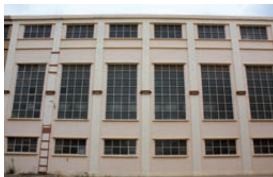
Fig. 6– Composición de las fachadas del taller de monturas.

La valoración que realiza Julián Sobrino de los Astilleros de Sevilla resulta también válida por la analogía existente para la factoría de Manises. Estas se basan en las tipologías tradicionales de plantas industriales de gran tamaño formadas por: “a) naves adosadas a dos aguas o exentas para servicios de almacén; b) naves de dientes de sierra adosadas para talleres de montaje, calderería, componentes eléctricos, etc.; edificios de una planta y cubierta plana para servicios de enfermería, vestuarios y laboratorio; d) bloques de plantas destinados a la gestión administrativa de la empresa; e) edificios singulares para la dirección de la empresa. Destacan en estas series tipológicas la torre de aguas y reloj y la