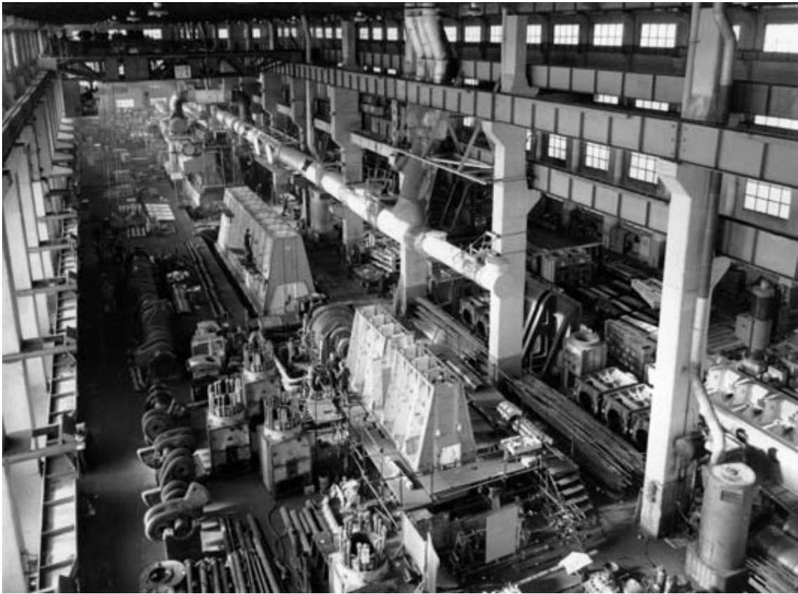
Fig. 7– Interior del taller de monturas a finales de los años sesenta.

Dentro del ambiente social de oposición al Régimen, en esta factoría, junto con las de MACOSA, Altos Hornos del Mediterráneo y Unión Naval de Levante, se gestó un importante movimiento sindical que reclamaba mejoras en las condiciones sociales y laborales de los trabajadores. La torre del reloj fue lugar donde se convocaron todas las manifestaciones de protesta y reuniones ilegales, ya que el régimen de Franco no reconocía estos derechos fundamentales 25 .