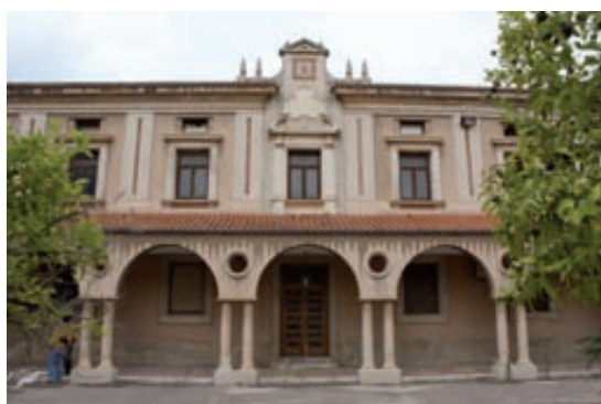
Fig. 9– Edificio de oficinas. Fachada principal.