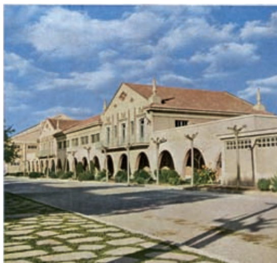
Fig. 8– Edificio de comedores. Imagen publicada en INI. Factoría de Manises de la Empresa Nacional “Elcano”... 1958.

Por otro lado la adopción de lenguajes historicistas responde al carácter representativo que adoptan estas construcciones, que además son las primeras que el visitante puede observar desde fuera a través de la cerca o desde el interior de la factoría. En ellas se utilizan materiales tradicionales como el ladrillo visto o revocado, donde el hormigón tiene muy poca presencia, ya que se concentra exclusivamente en los elementos arquitectónicos prefabricados que imitan la talla en piedra. Durante la postguerra se aprecia un retroceso en el proceso de apertura a las corrientes arquitectónicas de la vanguardia europea desarrolladas durante la República. La arquitectura oficial del Régimen encuentra