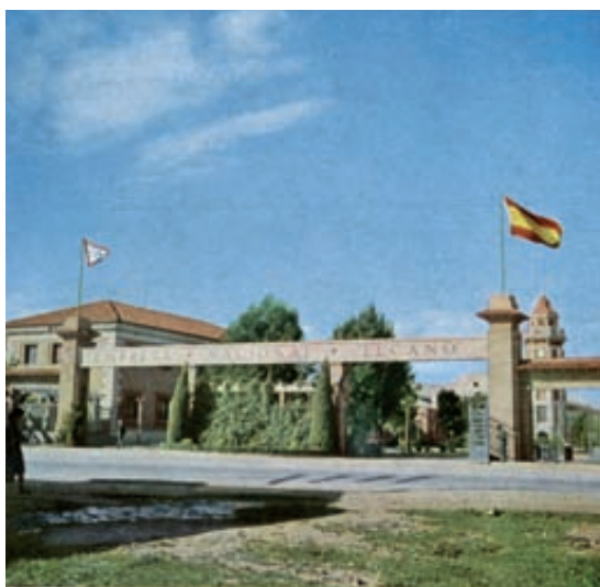
Fig. 5- Portada de acceso a la factoría antes de su remodelación. Imagen publicada en INI. Factoría de Manises de la Empresa Nacional "Elcano"... 1958.

La Empresa Nacional Elcano proyectó al mismo tiempo la factoría de Manises, dedicada a la fabricación de motores para barcos y maquinaria auxiliar, y los astilleros de Sevilla. A pesar de las diferencias funcionales en su actividad productiva, guardan estrecha relación en sus aspectos comunes. El principal es el aspecto organizativo, donde se diferencian claramente los